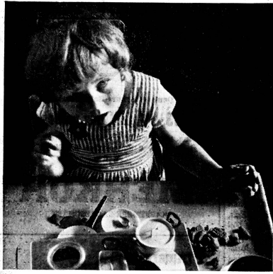
Abwartend beobachtet uns die zerebral gelähmte Puppenköchin: «Willst du meine verkrampften Hände anschauen oder... wirst du mit mir spielen, wie ich so gerne möchte?». Die Frage ist, ob wir vom Gebrechen gebannt sind oder das Menschenkind zu erfassen vermögen