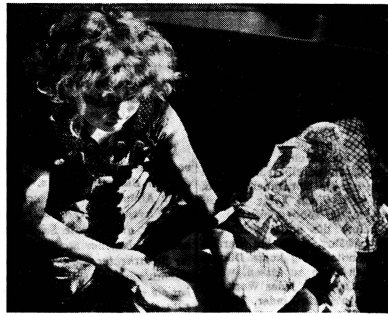
Wie auf dem Bild der kleinen epileptischen Puppenmutter gibt es im Leben der Behinderten Licht und Schatten. Jedes Gebrechen bringt mehr oder weniger grosse Schwierigkeiten mit sich. Zu deren Überwindung braucht es nicht nur den Einsatz von Eltern, Fachleuten, des Behinderten selbst, sondern auch wahrhaftige Mitmenschlichkeit unsererseits