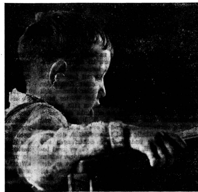
Mit welchem Eifer ist der kleine Schwerhörige bei seiner Leseübung! Gebrechliche Kinder erfassen oft erstaunlich schnell, worum es geht, und legen dann eine Ausdauer und einen Eifer an den Tag, die man bewundern muss