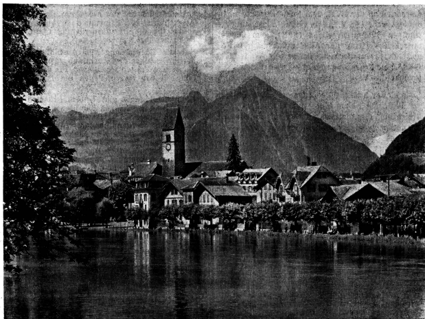
Interlaken: Alter Stadteil «Untersseen» an der Aare mit Niesen