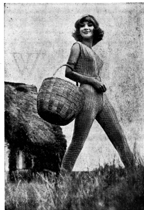
Strandanzüge aus «HELANCA»-Garn trägt man auch zu Hause, im Garten und für die Ferientour. Sie behalten immer ihre gute Passform. Modell: «Uhlis»-Dress 1963.

Dass Artikel aus «HELANCA»-Garn rasch trocknen, ist ein weiterer Vorteil dieses Materials, denn wer liebt es schon, stundenlang in der nassen Badehose an der Zugluft zu liegen? Das ist übrigens gerade das Stichwort für die Apres-Bain-Bekleidung, die dieses Jahr vermehrte Aufmerksamkeit geniesst. Auch an heissen Tagen kann es an der Küste oder im Schatten einen kühlen Wind haben, dem man sich nicht gerne schutzlos aussetzt. Darum wurde eine Fülle origineller Strandzüge geschaffen, in denen man sich sogar von zu Hause ins Strandbad begeben kann. Meistens sind es gut sitzende Slacks aus «HELANCA»-Garn, mit einem angearbeiteten Oberteil, das volle Bewegungsfreiheit gibt. Es gibt auch Modelle, bei denen über die Hose ein kunstvoller «HELANCA»-Pulli getragen wird, den man auch über die Badehose anziehen kann. Auch zu Hause, im Garten und für die Ferientour sind solche Dresses chic und praktisch, weil man sich darin ungestört nach allen Seiten bewegen kann und weil bei «HELANCA» keine ausgebeulten Knie zu befürchten sind.