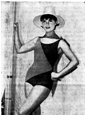
Klassisch geschnittener Badeanzug aus «HELANCA»-Garn, bei dem das formbeständige Material in einem abstrakten Diagonaleffekt zweifarbig verarbeitet wurde. Modell: «Porella».

wie beim Sonnenbaden. Darum ist es kein Wunder, dass ein grosser Teil fast aller Badekollektionen aus «HELANCA»-Garn gearbeitet ist. Dieses synthetische Kräuselgarn ist bekanntlich sehr hautfreundlich und angenehm im Tragen. Dazu zeichnet es sich durch eine aussergewöhnliche Formbeständigkeit in trockenem wie in nassem Zustande aus. Seine Elastizität, die ja sprichwörtlich «phantastisch» ist, verleiht den daraus gearbeiteten Badeanzügen bei jeder Bewegung einen untadeligen Sitz. Auch jene Modelle, die den losen Blousonschnitt haben, werden mit Vorliebe aus «HELANCA»-Garn hergestellt, weil sie sich in nassem Zustand keinesfalls verziehen dürfen, um nicht allen Charme zu verlieren.