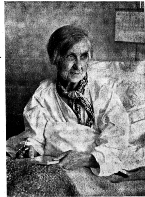
Liebevolle Betreuung wird alten und gebrechlichen Heimatlosen in der Pflegeabteilung im Flüchtlingsheim «Pelikan» des Hilfswerks der evangelischen Kirchen in Weesen SG zuteil.

Sammlung für die Flüchtlinge in der Schweiz Postcheck Nr. VIII 33000.