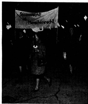
Vom Fackelzug der Zürcherinnen