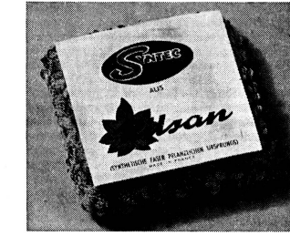
der gute Topfreiniger

leicht zu spülen schnell trocken auskochbar unverwüstlich