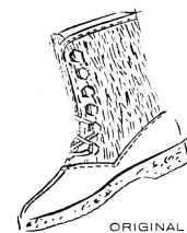
ORIGINAL HUG- MODELL 29

Die Stiefel sind der Mode der kurzgeschürzten Mäntel angepasst und haben gehsichere Absätze. Das zu diesem Zweck verarbeitete Material ist Velours-, auch Glattleder; für das hochmodische jugendliche Genre wurde sogar weisses Lackleder verwendet.