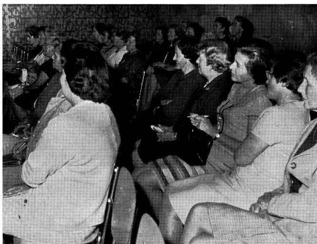
Thalwil gründet ein Frauenpodium

Daraus lässt sich das im Grunde Unerwartete folgern: Im heutigen Leitbild ist die Familie, das Kind, bedeutungsvoller als vor 30 Jahren. Die Gesellschaftswissenschaft bezeichnet die Familie als den Ort der Wahl, wo entsprechend der ihr innewohnenden Kraft etwas Positives oder Negatives entsteht. Die Diskussion ergibt: Elternschulung müsste bewusst machen, was eigentlich an Wandlungen vor sich geht, um die notwendige Anpassungshilfe zu leisten. Moralische, ethische Anweisung kann Information nicht sein, auch wenn sie von einem Theologen gegeben wird, sondern nur Hinweis. Auch die Bibel, das Christliche, kann letzten Endes in der Elternschulung nur in jener Wegweisung gipfeln: Du bist der Mensch, an den ich gewiesen bin, den ich zu verstehen habe. Damit ergab auch diese Standortbestimmung die Notwendigkeit einer Schulung zu zeitgemässer Partner- und Elternschaft als Gebot der Zeit.