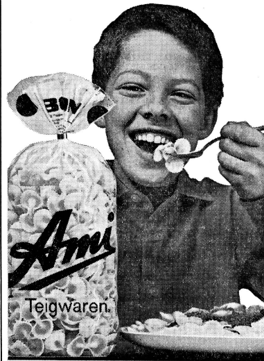
das sind Frischeier-Teigwaren!