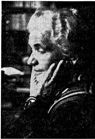
fremde Bäuerin – in der «Matrena» hat er ihre Gestalt verewigt – bei sich aufgenommen.

Der 1918 geborene Alexander Solschenizyn, nun fünfzigjährig, ist wohl der Bedeutendste und darum wohl auch einer der Gebekbeltesten, der in innerer Emigration als Prosa-Schriftsteller in der UdSSR lebt. Er studierte Physik und Mathematik in Moskau, spezialisierte sich dann auf Geschichte und Philosophie. Er machte den Krieg mit und wurde 1945 zu acht Jahren Straflager Sibirien verurteilt, weil er sich in einem Brief an einen Freund negativ über den Machthaber geäussert hatte, ohne den Namen Stalins zu nennen. 1953 entlassen, körperlich unterhohlt, musste er sich einer schweren Krebsoperation unterziehen. Mittleres, dem Zufall ausgesetzt, wäre er elend zugrunde gegangen, und niemand hätte ihn als einen hervorragenden Schriftsteller kennengelernt, hätte ihn nicht eine