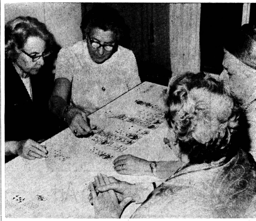
Mitglieder des Zürcher Seniorenklubs, die beim wöchentlichen Treffen zum Patiencespiel immer wieder neue Anregungen erhalten.

Ein interessantes Projekt ist das Gemeinschaftshaus, als besonderes Anliegen der Zürcher FZ, nämlich der Bau von Alterswohnungen für den im Sozialprogramm benachteiligten Mittelstand. Es ist ein Legat dafür in Reserve gestellt. Einige gemeinnützige Organisationen machten den Vorschlag, einen gemeinsamen Bau für verschiedene Gruppen Beschäftigter zu prüfen. Die Stadt gibt diesen Organisationen eventuell ein eigenes Grundstück im Baurecht ab und forderte sie auf, eine Ueberbaustudie und daraus ein Vorprojekt auszuarbeiten. Die Studie liegt vor, und es heisst für die FZ, sich demnächst zu entscheiden, ob sie sich an dem geplanten Gemeinschaftshaus beteiligen will.