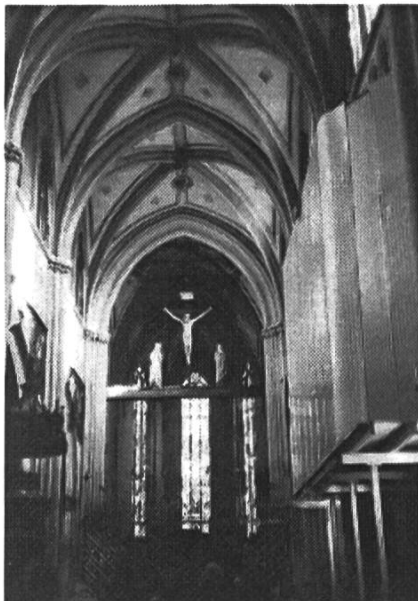
Blick zum Chor der Kathedrale

Als bald fanden wir uns ein in der Kathedrale St. Nikolaus, die als besonderes Bauwerk weit über Fribourg sichtbar ist. Ihr Portal ist mit einem Relief aus dem 14. Jahrhundert geschmückt, welches das Jüngste Gericht mit Hölle und Paradies darstellt, während die Fassade mit zwölf Apostelstatuen geschmückt ist. Wir nahmen Platz im polygonalen Chor und betrachteten das grosse, moderne Kreuz über dem Hauptaltar, dessen nach oben gerichtete Arme die Auferstehung symbolisieren sollen. Beeindruckt haben die vom polnischen Maler Józef Mehoffer (1869 – 1946) zwischen 1896 und 1936 geschaffenen Kirchenfenster im Jugendstil, die 1970 durch den französischen Künstler