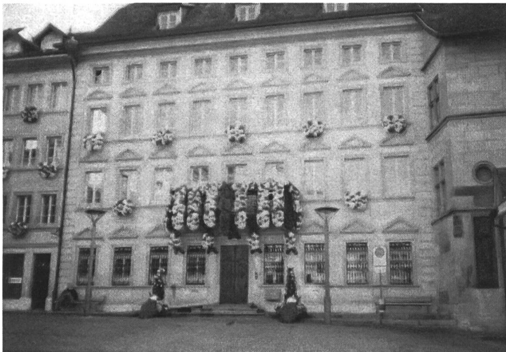
Das Stadthaus – links neben dem Rathaus

Der Rundgang begann sogleich bei einem bedeutenden Bauwerk, dem Rathaus, das von 1501 bis 1522 an der Stelle der ehemaligen, im 15. Jahrhundert zerstörten Zähringer Burg erbaut wurde. Unsere Aufmerksamkeit fand auch das nebenan stehende Stadthaus von 1731, das sich mit einer Stilmischung aus Barock und Klassizismus präsentiert. Blickfang bildeten die von einem Balkon herunterhängenden prächtigen Blumengirlanden. Eine besondere Legende rankt sich um die Murten-Linde, die einst auf der gegenüberliegenden Seite stand. Gemäss Überlieferung schwenkte der Bote, der 1476 in Fribourg die Siegesnachricht über Karl den Kühnen überbringen sollte, auf dem Weg einen Ast, den er von einer Linde auf dem Schlachtfeld abgebrochen hatte.