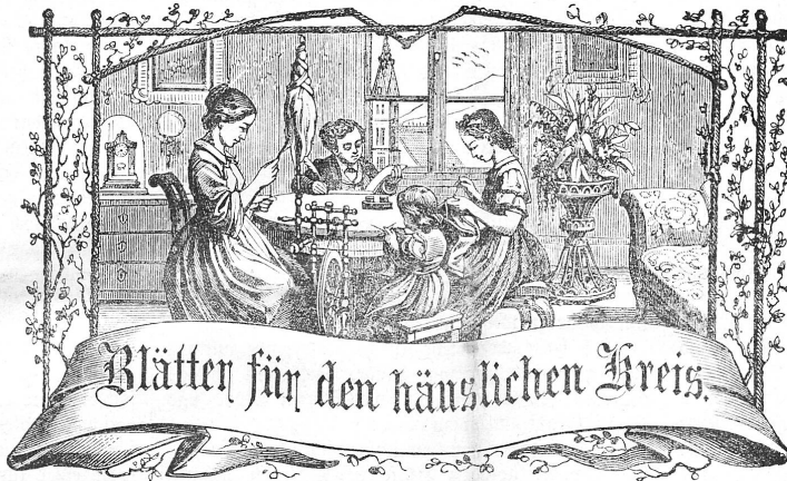
Motto: Stets strebe zum Ganzen; — und fannst Du ein Ganzes nicht sein, So schliesse als williges Glied dienend dem Ganzen Dich an.

Insertion: 15 Centimes per einpaltige Petitzeile. Bei Wiederholungen Rabatt.