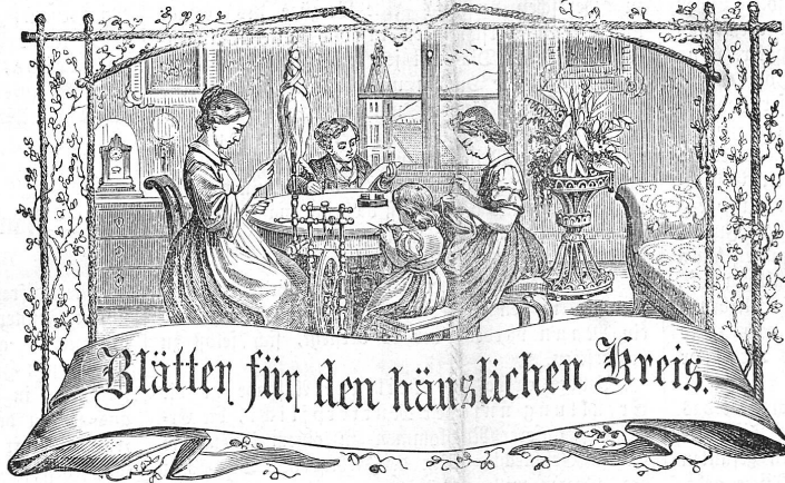
Worte: Stets strebe zum Ganzen; — und kannst Du ein Ganzes nicht sein, So sätteste als williges Glied dienend dem Ganzen Dich an.

Insertion: 15 Centimes per einpaltige Zeitspalt. Bei Wiederholungen Rabatt.