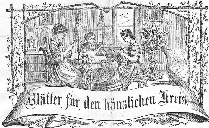
Motto: Stets strebe zum Ganzen; — und kannst Du ein Ganzes nicht sein, So schätze als williges Glied dienend dem Ganzen Dich an.

Abonnement: Bei Franko-Zustellung per Post Jährlich . . . . . Fr. 5. 70 Halbjährlich . . . . . „ 3. — Vierteljährlich . . . . . „ 1. 50 Ausland mit Zuschlag des Porto.