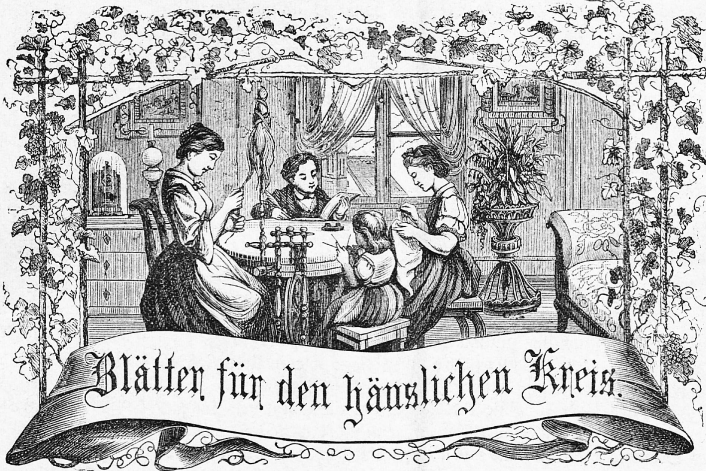
Motto: Nimmer strebe zum Ganzen; — und kamst Du selber kein Ganzes werden, Als dienendes Glied schlies' an ein Ganzes Dich an.