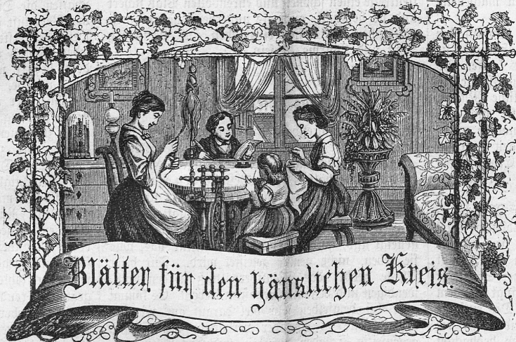
Motto: Immer strebe zum Ganzen; — und kannst Du selber kein Ganzes werden, Als dienendes Glied schliesse dem Ganzen Dich an.