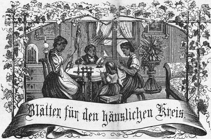
Motto: Immer strebe zum Ganzen; — und kannst Du selber kein Ganzes werden, Als dienendes Glied schliesse dem Ganzen Dich an.

Telephon in der Källin'schen Druckerei. Telegramm-Expresen: 50 Cts.