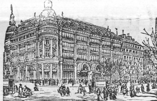
GRANDS MAGASINS DU