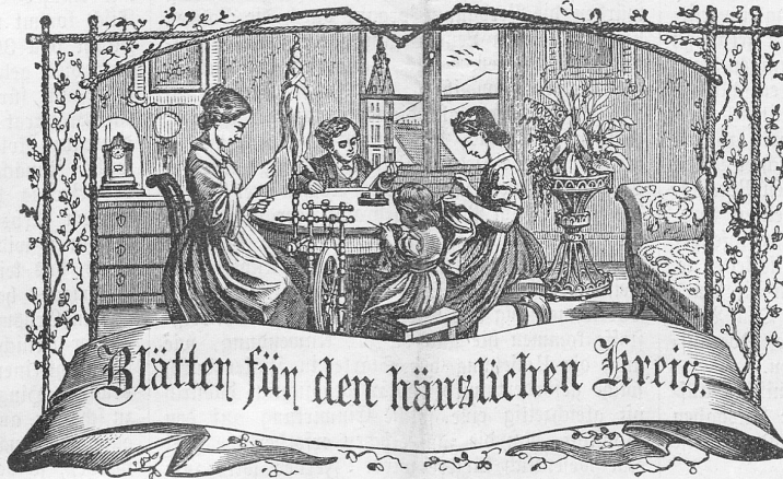
Motto: Immer strebe zum Ganzen; — und tannst Du selber kein Ganzes werden, Als dienendes Glied schlicke dem Ganzen Dich an.

Telegramm-Expresen: 50 Cts. Telefon in der Kuhn'schen Druckerei.