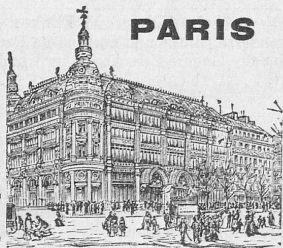
GRANDS MAGASINS DU

Oettinger & Cie., Centralhof, Zürich. P. S. Muster-Collectionen u. Modelbilder bereitwilligst.