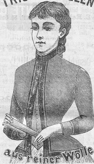
aus reiner Wolle

Nur reelle Qualitäten und ganz vor- züglicher Schnitt. Leichte, mittlere und schwere Qualität in schwarz und farbig. [3451]