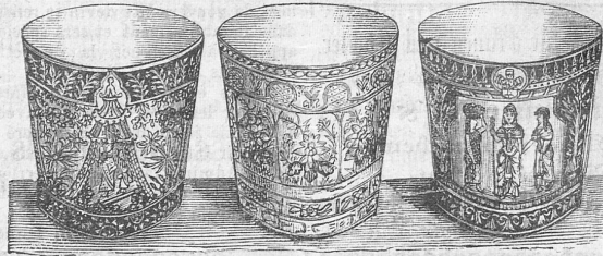
Nr. 2 Nr. 3 Nr. 1

Nach stylgerechten Vorlagen in 4—12 Farben auf starken Carton gedruckt.