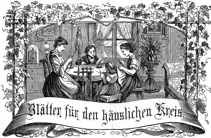
Motto: Immer treu zum Ganzen; — und launst Du selber kein Ganzes werden, Als dienendes Glied schliesse dem Ganzen Dich an.

Telephon in der Buchhandlung Katharinengasse 10, beim Theater