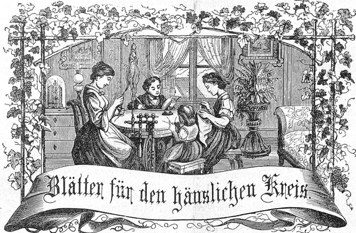
Motto: Immer strebe zum Ganzen; — und laßst Du selber kein Ganzes werden, Als dienendes Glied schließe dem Ganzen Dich an.

Abonnement: Bei Franko-Zustellung per Post: Jährlich . . . . . Fr. 6.— Halbjährlich . . . . . „ 3.— Zus Ausland sfo. per Jahr „ 8. 30