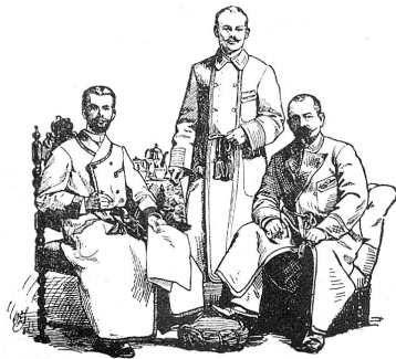
Façon 1. Façon 2. Façon 3.

u. s. f. Lager fortwährend in 25 Qualitäten. Umtausch gestattet. Eigene Reinigungs-Anstalt. Reinigungs-Dampf- und Dörrmaschinen neuesten Systems. Auf Verlangen Muster sofort. [76]