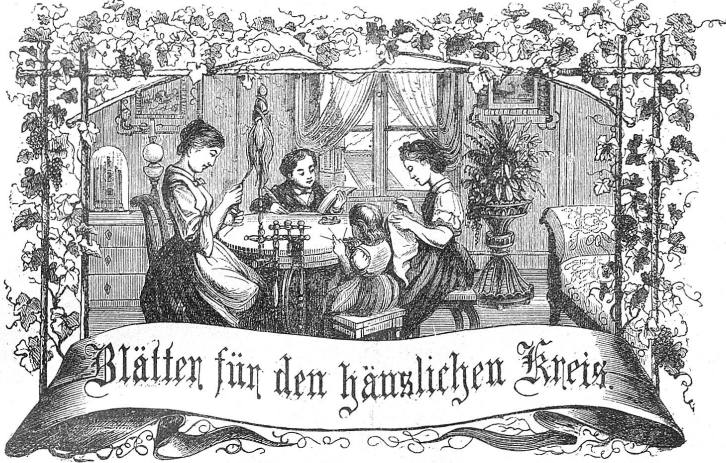
Motto: Immer strebe zum Ganzen, und kannst du selber kein Ganzes werden, als dienendes Glied schlies an ein Ganzes dich an!

Organ für die Interessen der Frauenwelt.