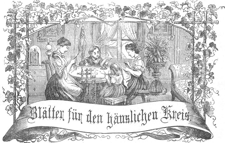
Motto: Immer strebe zum Ganzen, und kannst du selber kein Ganzes werden, als dienendes Glied schliesst an ein Ganzes dich an!

Organ für die Interessen der Frauenwelt.