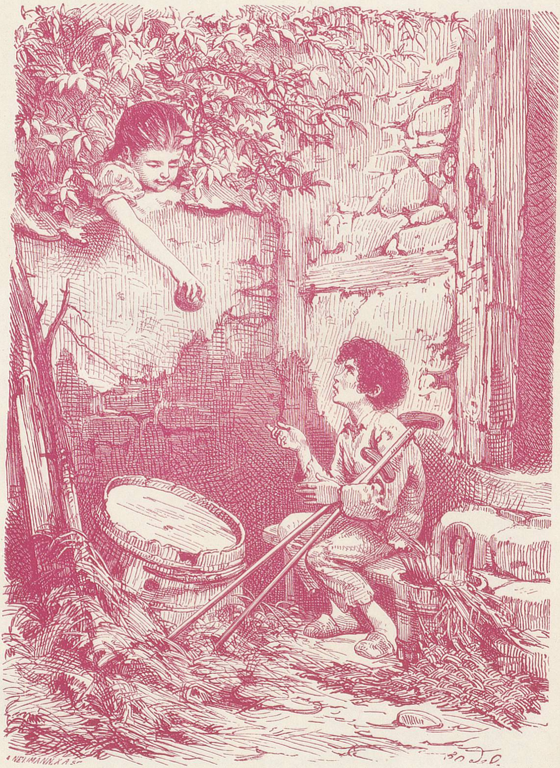
Lilli's erste Wohlthat.