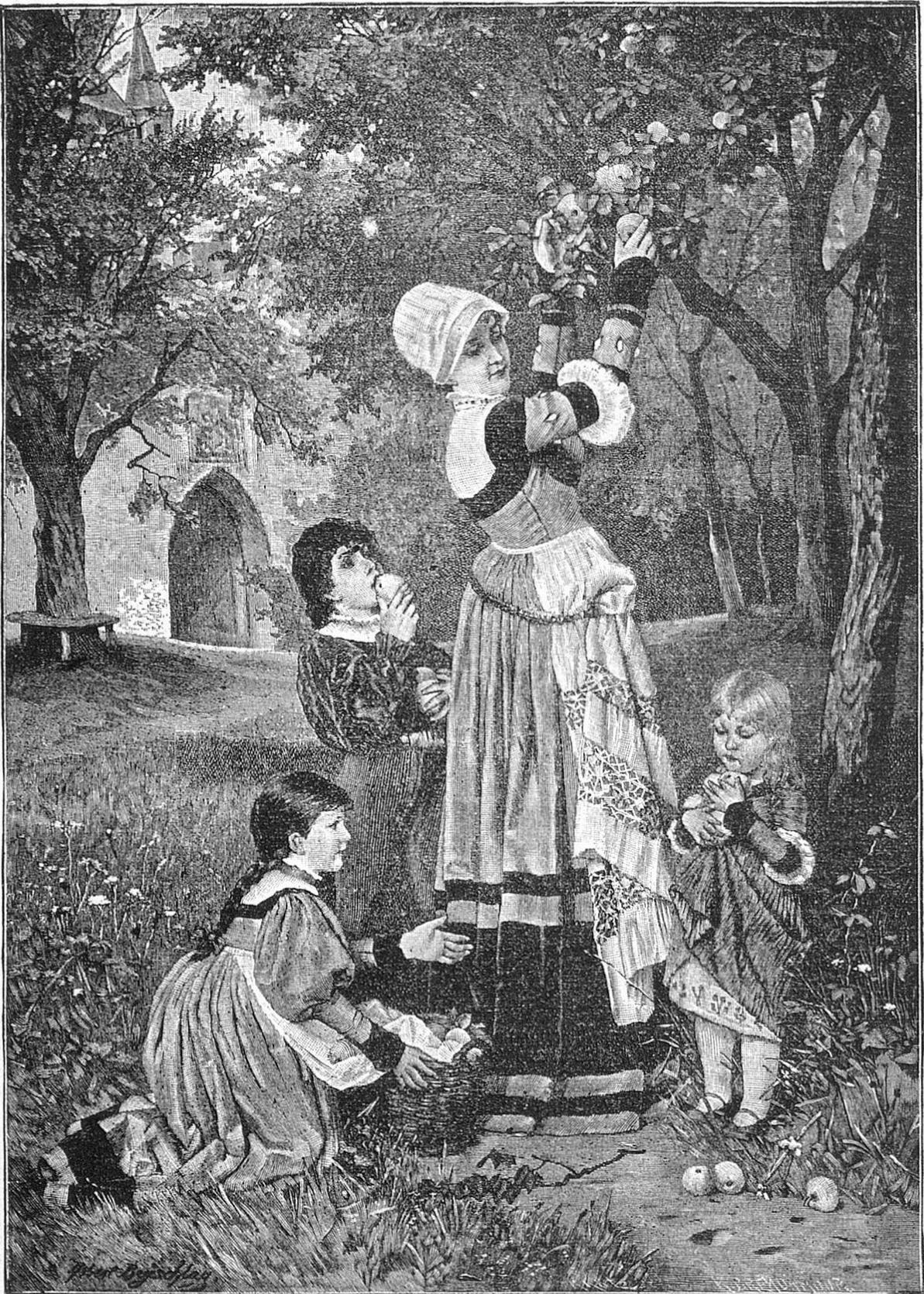
Des Herbstes Erstlinge.