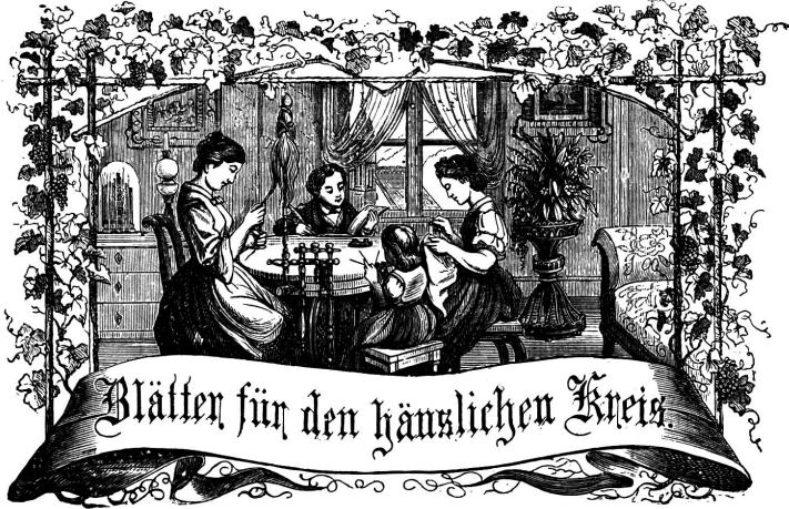
Motto: Immer strebe zum Guten, und kannst du selber kein Ganzes werden, als dienendes Glied schlies an ein Ganzes dich an!