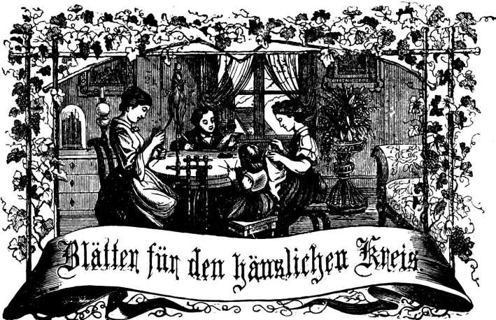
Motto: Immer strebe zum Ganzen, und kannst du selber kein Ganzes werden, als dienendes Glied schlies an ein Ganzes dich an!

Organ für die Interessen der Frauenwelt.