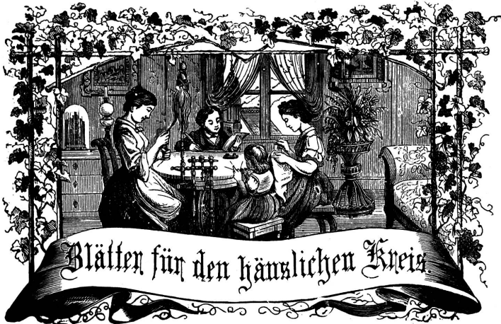
Motto: Immer strebe zum Ganzen, und kannst du selber kein Ganzes werden, als dienendes Glied sitzest an ein Ganzes dich an!

Organ für die Interessen der Frauenwelt.