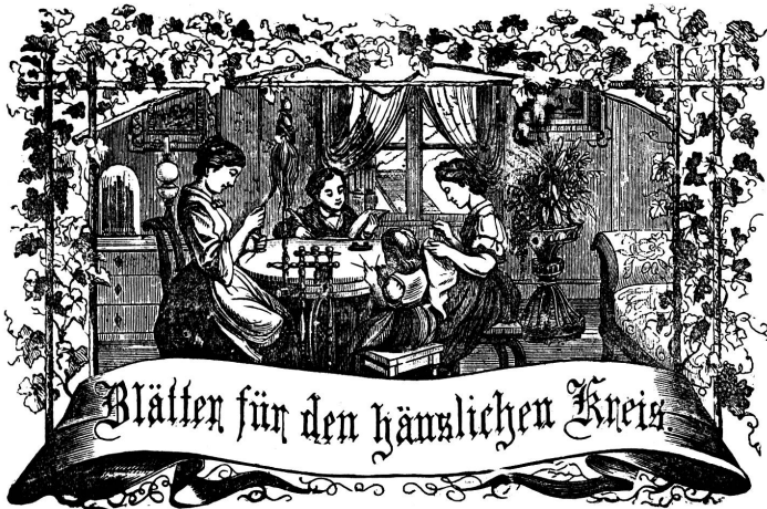
Wotto: Immer strebe zum Gange, und kommst du selber kein Gange werden, als dienendes Glied istlich an ein Ganges dich an!

Organ für die Interessen der Frauenwelt.