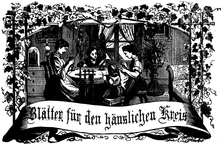
Motto: Immer freie zum Gange, und laß dich nicht von fremden Händen an ein Gange dich an!

Organ für die Interessen der Frauenwelt.