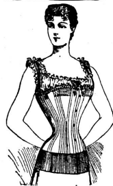
Mit Gürtel: Schlanke Figur!

Suppen-Würze Bouillon-Kapseln Suppen-Rollen