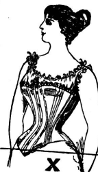
Ohne Gürtel: Starke Figur!

Zu beziehen durch die Gummi-Wirkerei Hofman in Elgg (Kt. Zürich).