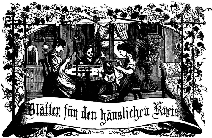
Witz: Immer freude zum Gange, und kannst du selber kein Gange werden, als dienendes Glied schließ an ein Gange dich an!

Organ für die Interessen der Frauenwelt.