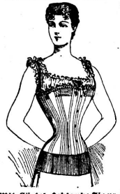
Mit Gürtel: Schlanke Figur!

Suppen-Würze Bouillon-Kapseln Suppen-Rollen