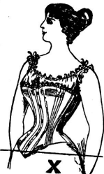
Ohne Gürtel: Starke Figur!