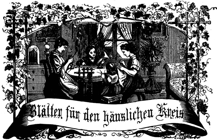
Wort: Immer strebe zum Ganzen, und kommst du selber kein Ganzes werden, als dienendes Glied schließ an ein Ganzes dich an!

Organ für die Interessen der Frauenwelt.