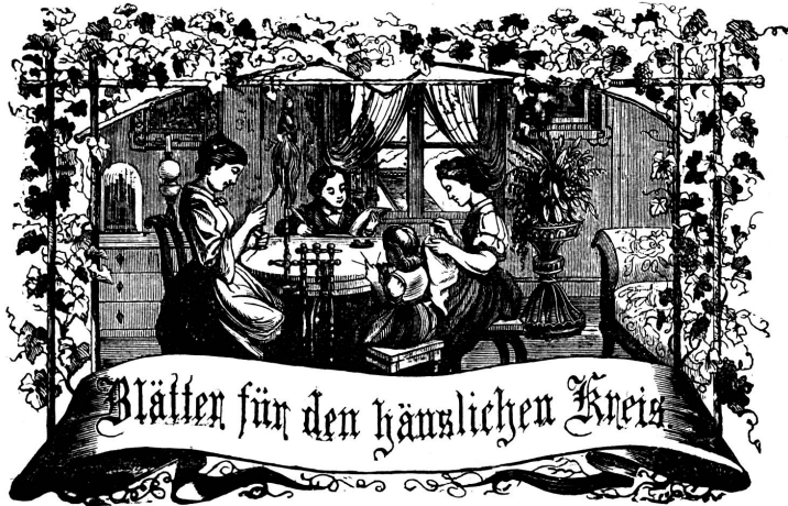
Motto: Immer krebe zum Ganzen, und kannst du selber kein Ganzes werden, als dienendes Glied schliesst an ein Ganzes dich an!

Organ für die Interessen der Frauenwelt.