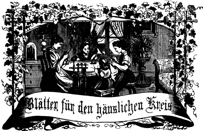
Wohls! Immer freude zum Gange, und kannst du selber kein Ganges werden, als dickeles Glied istlich an ein Ganges dich an!

Organ für die Interessen der Frauenwelt.