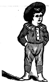
I WEAR THEM Jetzt.