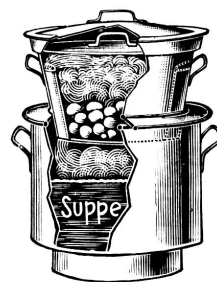
Aufsatz auch allein, erhältlich.