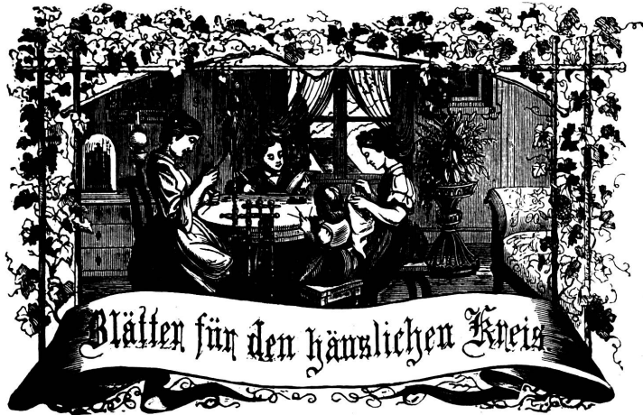
Motto: Immer strebe zum Gange, und kannst du selber kein Gange werden, als die andere dich schick an ein Gange dich an!

Organ für die Interessen der Frauenwelt.