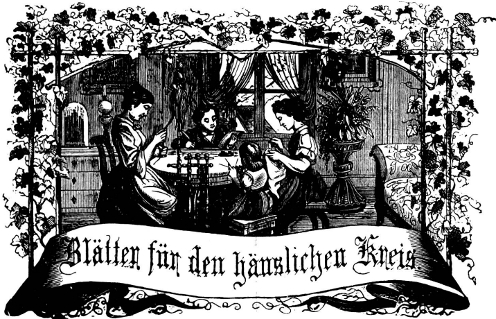
Wohls: Sommer freude zum Gelingen, und dannst du selber dein Ganges Herben, als blühendes Gies (schick an ein Ganges dich an)

Organ für die Interessen der Frauenwelt.