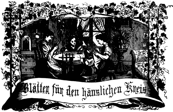
Motto: Immer frohe am Ganzen, und tannst du selber kein Ganzes werden, als dienend Glück schick an ein Ganzes dich an!

Organ für die Interessen der Frauenwelt.