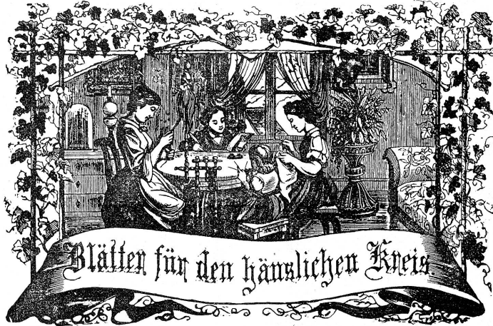
Worte: Tamer trebe zum Gange, und kannst du selber kein Gange Werben, als blosses Glied schick es ein Gange dich an!

Organ für die Interessen der Frauenwelt.