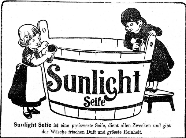
Sunlight Seife ist eine preiswerte Seife, dient allen Zwecken und gibt der Wäsche frischen Duft und grösste Reinheit.

Man verlange jedoch ausdrücklich das echte „Dr. Hommel's“ Haematogen und lasse sich keine der vielen Nachahmungen aufreden.