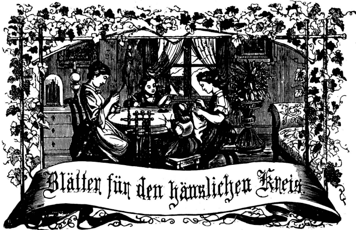
Motto: Immer strebe zum Ganzen, und kommst du selber kein Ganzes werden, als dienendes Glied schliesst an ein Ganzes dich an!

Organ für die Interessen der Frauenwelt.