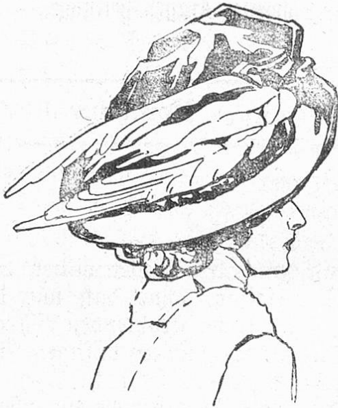
Fig. 2. Aufgeschlagener Filzhut mit Sammetkopf.

Das heute stets im ganzen gearbeitete Kleid, gleichviel ob es Prinzessschnitt oder Empireform aufweist, ist entweder einem zusammenhängenden Futterkleide aufgebracht oder, wenn gängig, ganz ungefüttert hergestellt.