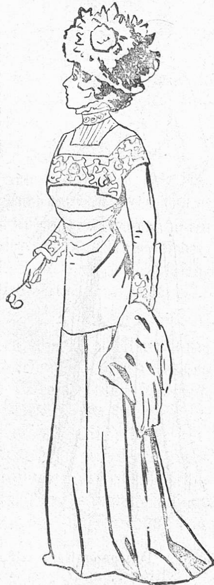
Fig. 3. Drapiertes Kleid aus staubiglila Tuch mit gleichfarbiger Kurbelstickerei.

Charakteristisch am modernen Kleide ist auch, daß es nahezu immer im Rücken geschlossen wird. Für Gesellschafts- und Balltoiletten sind ganz wunderhübsche Modelle zur Wahl gestellt. Sehr modern ist immer noch der angeschnittene Ueberärmel in enger Form (s. Fig. 3), der der Schulter ihre schlanke Linie wahrt. Hier sei gleich gesagt, daß alle Versuche, den weiteren Ärmel zu lancieren, vorläufig kläglich gescheitert sind an dem Widerstand des Publikums. Zielbewußt treibt die Mode den drapierten Kleidern zu, die schon lange prophezeit waren, nun treten sie in so verlockender Gestalt auf mit den nur zart angedeuteten Falten in den weichen Geweben, daß man in kurzem keine ungebrochene Linie mehr wird sehen wollen. Um die Taille zieht sich der Stoff in leichter Drapierung bis zur Hüfte, diese selbst straff unspannend, oder die Draperie beginnt erst unter den Knien, hier den Rock scharf zusammenfassend in Knoten und Schleifen. Auch der hübschen Mode der umgeschlungenen Char-