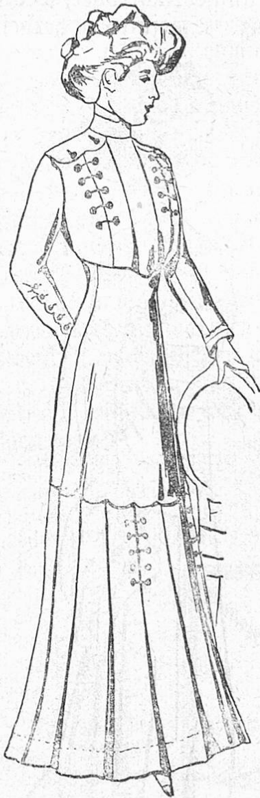
Fig. 1. Hüftpassenkleid mit Knopfschmuck.

So sind wir also wieder mitten drin in der Winterfaison, ohne daß wir den Sommer mit all seiner strahlenden Wärme, auf die Tag für Tag unsere duftigen leichten Toiletten warteten, so recht eigentlich genießen konnten. Es geht wie ein erleichtertes Aufatmen durch die Welt der Mode, daß wir nun nicht mehr so abhängig von Wetterlaunen sind, der Winter ist immerhin ein zuverlässigerer Gesell als der Sommer, er verspricht wenigstens nicht mehr wie er halten kann. Und spendet er uns einmal etwas mehr Wärme, als wir erwarten dürfen, so nehmen wir sie dankbar hin und lüften nur ein wenig die Pelzhülle, die der leichten Toilette als Ergänzung gegen die Unbilden der kalten Witterung dient. Denn eine Dame, die nur einigermaßen den Modevorschriften folgt, trägt heutzutage kein schweres warmes Kleid mehr; das bedeutet einen großen Fortschritt sowohl in künstlerischer wie hygienischer Beziehung.