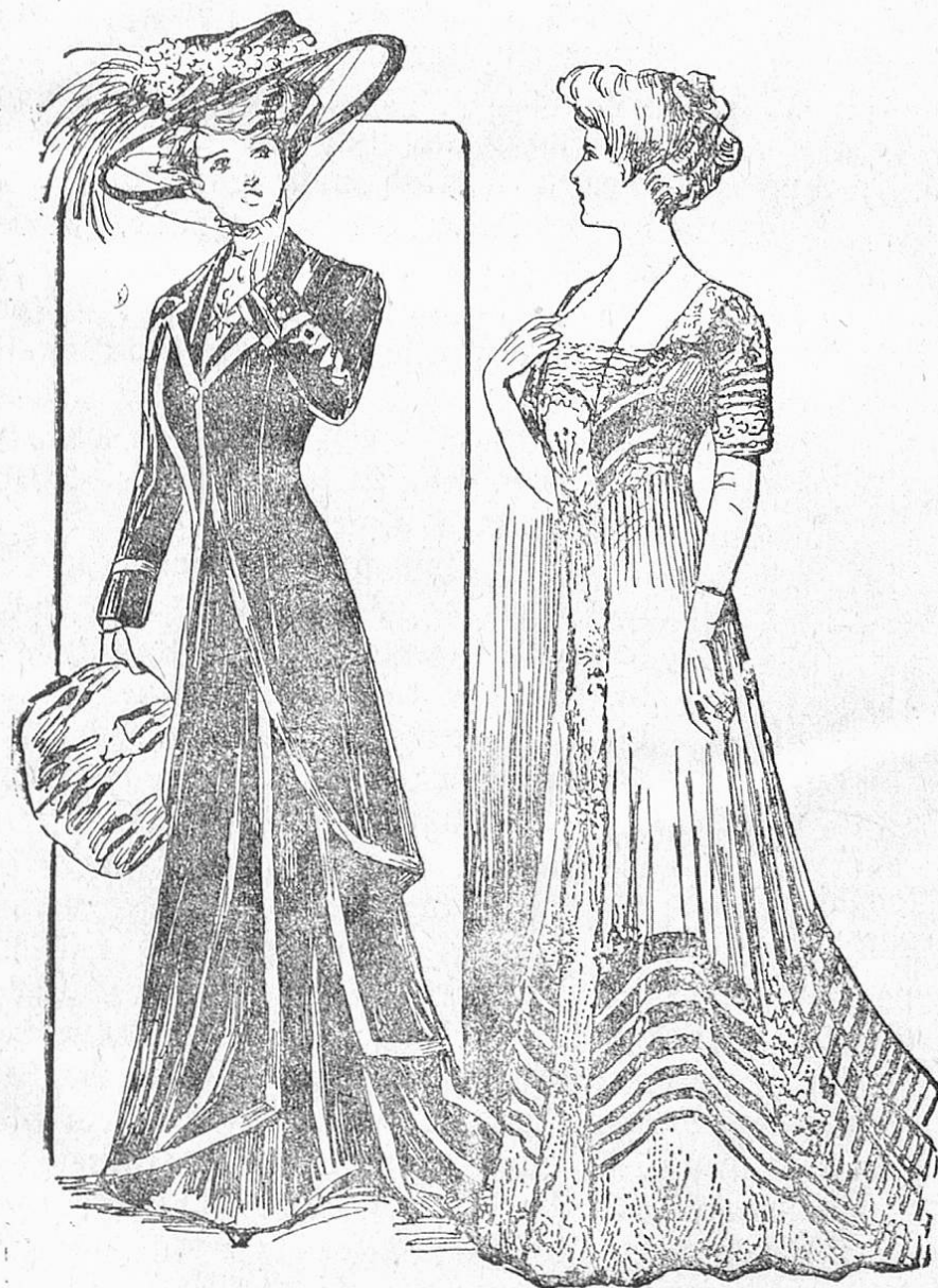
Fig. 1. Sammetkostüm mit langer Jacke und geschliztem Rock.