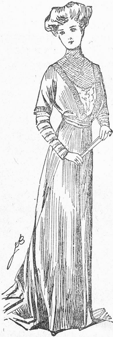
Fig. 3. Nachmittagskleid mit engem Rock.

Wo sind die Zeiten geblieben, da man von einem Ballkleide in erster Linie verlangte, daß es seine Trägerin wie eine leichte, duftige Wolke verhülle und zu diesem Zwecke eine verschwenderische Leppigkeit