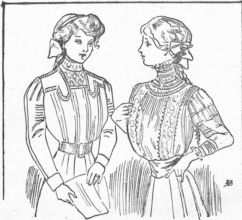
Fig. 5. Wollbluse mit Passe.