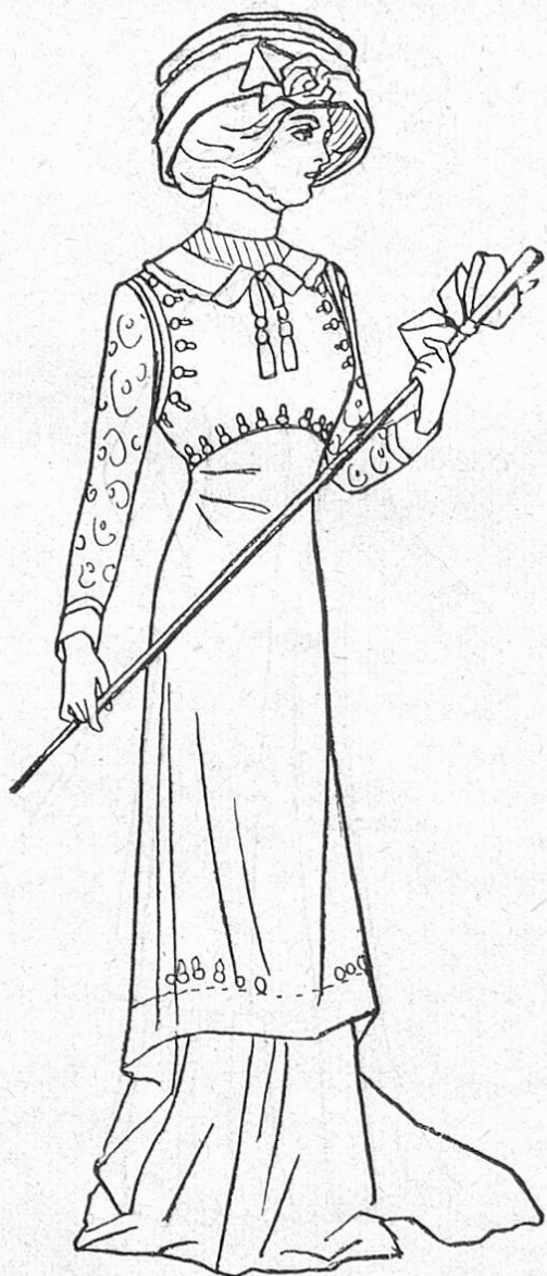
2. Kleid mit Fächergarnitur.

Die untere Weite des Mantels trägt gewissermaßen der Jahreszeit Rechnung; denn im Winter ist es doch nicht mehr angängig, den Paletot ganz offen zu