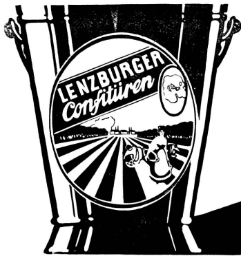
Der 5 Kilo Eimer