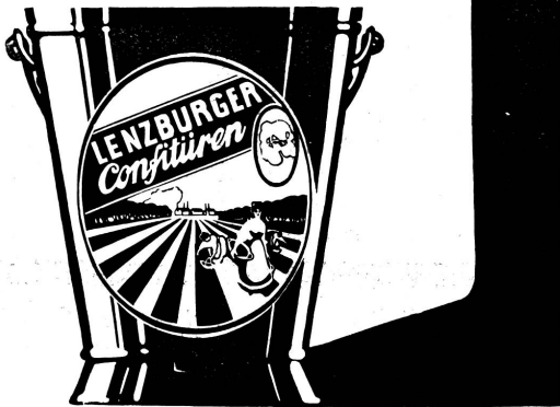
• Der 5 Kilo Bimer •